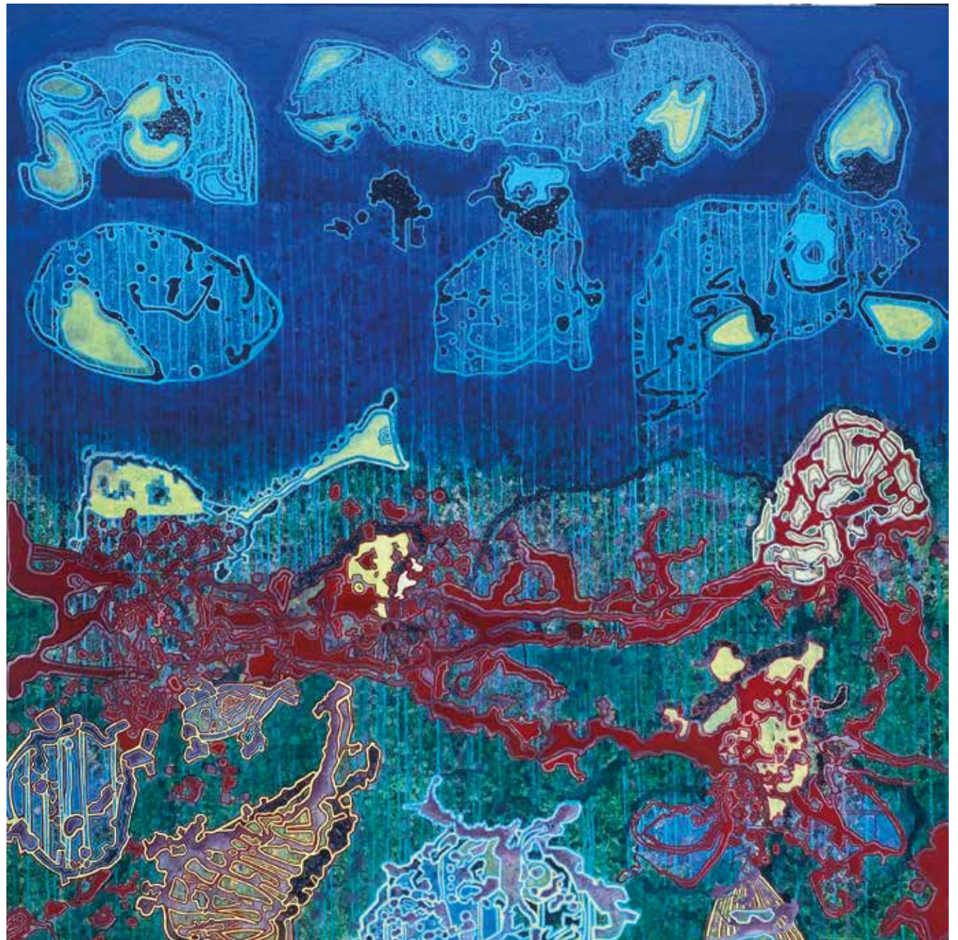
Illustration : Mystigris

IA et écologie ne font pas bon ménage : « L'industrie mondiale des centres de données, de l'IA et des cryptoactifs devrait doubler sa consommation d'électricité d'ici 2026, générant un surplus de 37 milliards de tonnes de CO 2 dans l'atmosphère. Ce qui représente l'équivalent de la consommation annuelle d'un pays comme le Japon 6 ». De plus, le fonctionnement d'une IA telle que ChatGPT (195 millions de demandes journalières en juillet 2024) requiert, grosso modo , 564 mégawattheures par jour – soit l'équivalent de la consommation annuelle de 282 foyers wallons 7 . Ce n'est pas tout ; ces mastodontes virtuels nécessitent une puissance de calcul considérable générée par des centres de données (bien physiques pour le coup) : les fameux data centers . En France, avec la propagation de l'IA, le seul secteur des data centers pourrait mobiliser la puissance