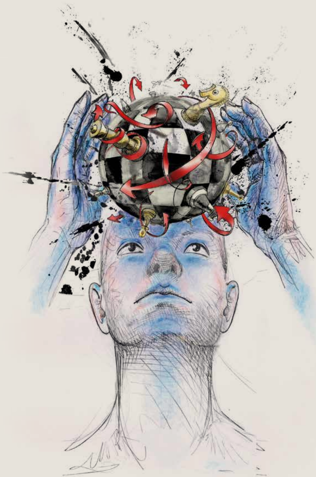
Illustration : Titus S. Dairelbes

La Chine, avec ses infrastructures futuristes et son avance technologique, devient un modèle de développement, contrastant avec la colonisation occidentale. Elle forme avec la Russie et l'Inde un triangle stratégique, au cœur d'un cercle économique en plein essor, englobant la moitié de la population mondiale. En résumé, Trump, en brouillant les cartes diplomatiques, pourrait redéfinir les alliances occidentales, tandis que Poutine et Xi redessinent l'ordre mondial. Trump, influencé par son passé de businessman , cherche à libérer les États-Unis de leur rôle de « gendarme du monde ». Poutine, Européen traditionaliste, restaure la Russie face à un Occident déclinant. La Chine, sous Xi, émerge comme une puissance structurée, contrastant avec un Occident en crise. Ces dynamiques suggèrent un basculement géopolitique, où les alliances traditionnelles, comme l'OTAN, pourraient être remises en question. Au demeurant, l'OTAN est illégale au regard de la charte des Nations unies en raison de son caractère d'alliance automatique.