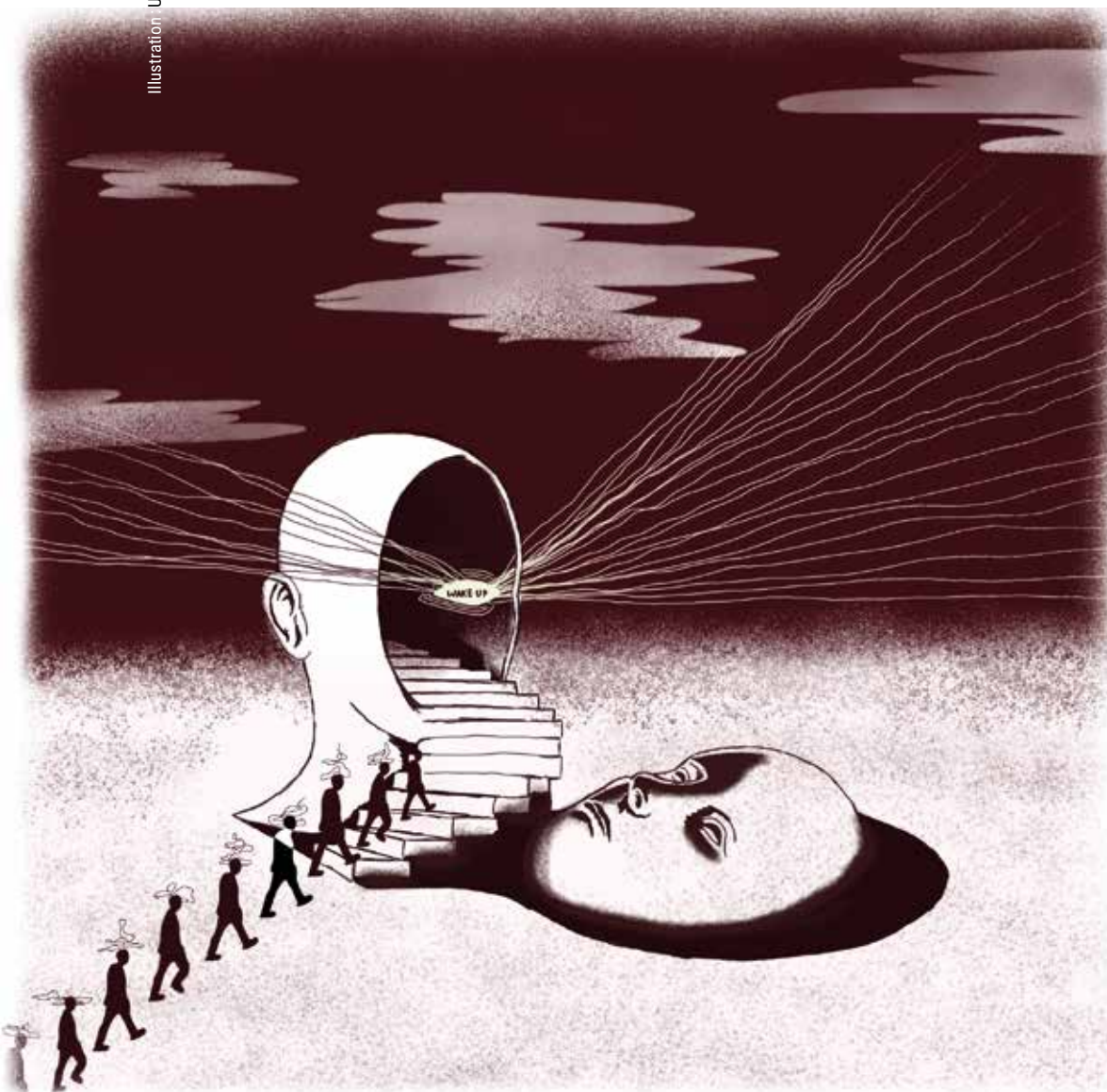
Illustration : Uncanny Bee

Il nous fut récemment rappelé que cela faisait déjà 5 ans que le covid nous avait frappés. En cet honneur, les médias mainstream nous ont servi des articles et des émissions provoquant des nausées dignes de la gastro-entérite qui a circulé cet hiver dans notre plat pays. Parmi ces derniers, « Cinq ans plus tard, que sont devenus les complotistes du covid ? » publié dans Le Soir , nous explique la dynamique d'une forme de convergence des luttes entre ceux qui se sont opposés aux mesures sanitaires, ceux qui craignent la 5G, ceux qui critiquent le soutien à l'Ukraine, ceux qui évoquent le forum de Davos, Rothschild, Rockefeller, Vanguard, Bill Gates, etc. Les auteurs expliquent qu'une fois que la confiance en les institutions et les médias est rompue, tout peut être remis en question et qu'« il est difficile d'en revenir [du complotisme, Ndlr] ». Apparemment, le complotisme « prospère sur les crises, parce qu'il offre un logiciel explicatif qui désigne les coupables, les héros, un but à poursuivre ». Les auteurs déplorent cette méfiance, d'autant plus qu'il y aurait « une matrice commune entre l'extrême droite et la complotosphère ».