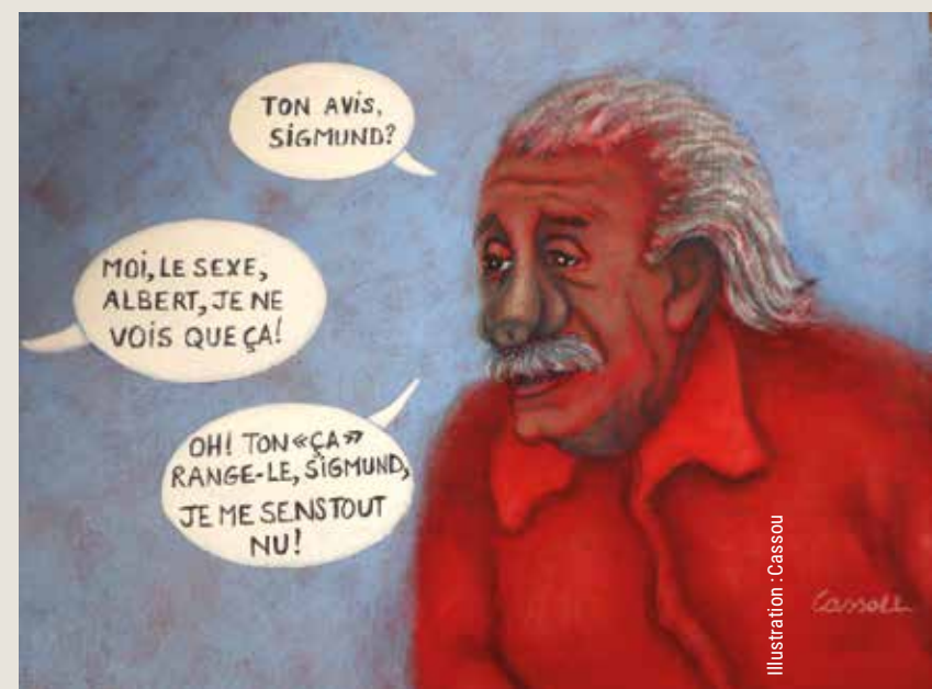
Illustration : Cassou

Elle repose sur des fondements soi-disant nobles – mais en réalité radicalement bourgeois – édictés par les politiques. Ceux-ci constituent la représentation physique sur laquelle le