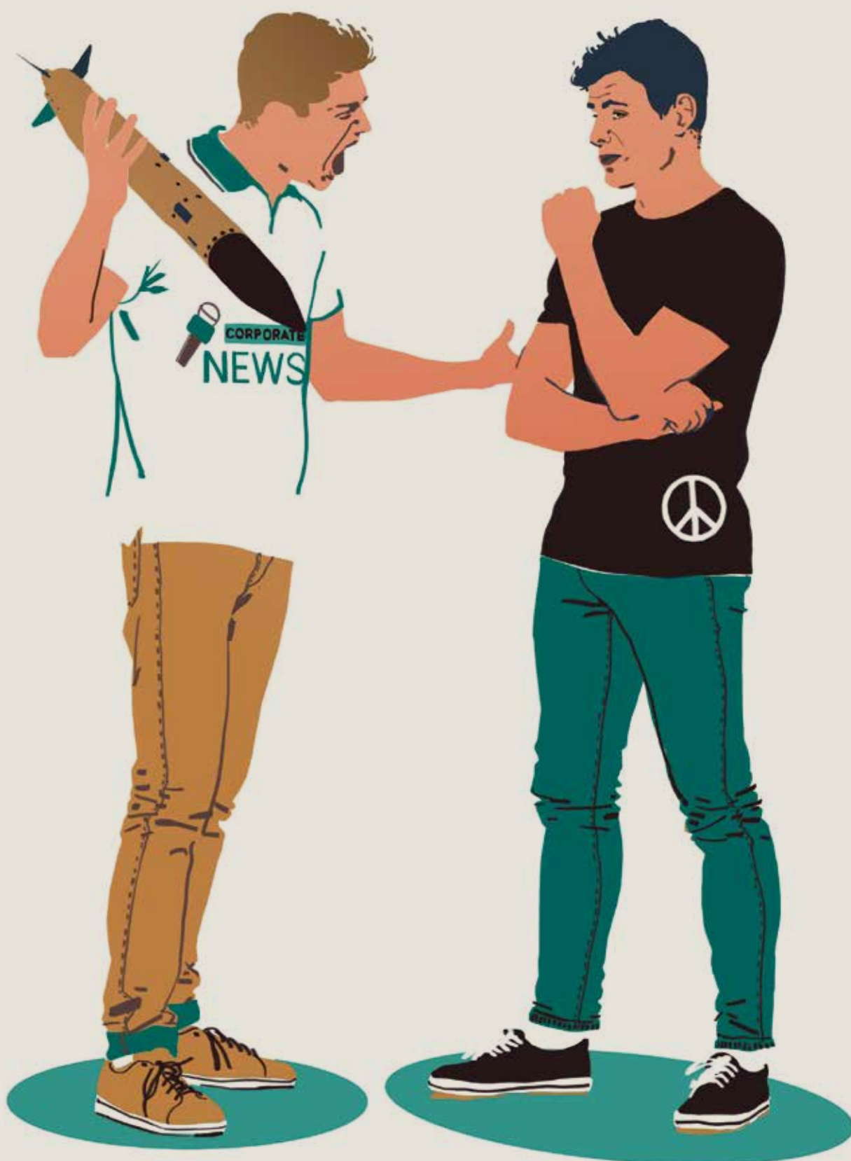
Illustration : Philippe Debongnie