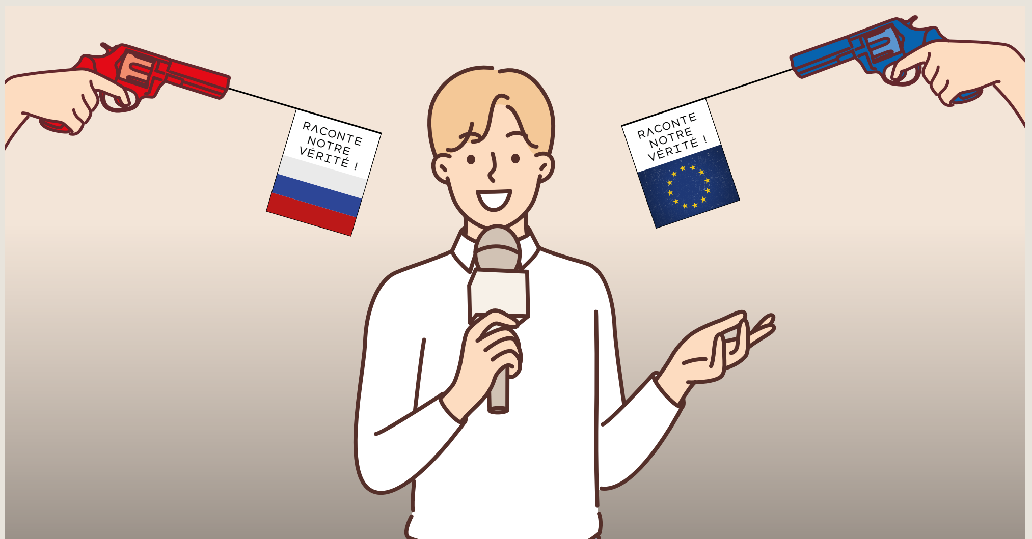
Illustration : NOIR&CLAIR