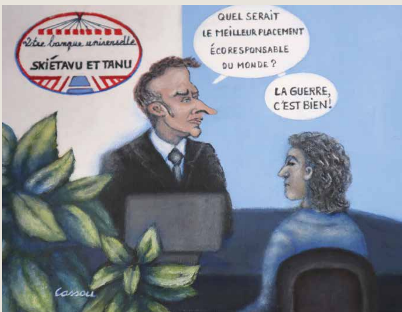
Illustration : Cassou

D'une part, éteindre les machines à abrutir que sont le téléviseur et la radio pour étudier l'histoire et retourner aux sources culturelles de l'Europe ; d'autre part, pratiquer l'éthique, « qui naît du désir de dire quelque chose de la signification ultime de la vie, du bien absolu, de ce qui a une valeur absolue 8 », voilà ce que nous pouvons déjà entreprendre pour tenter de faire dérailler le train fou du bellicisme.